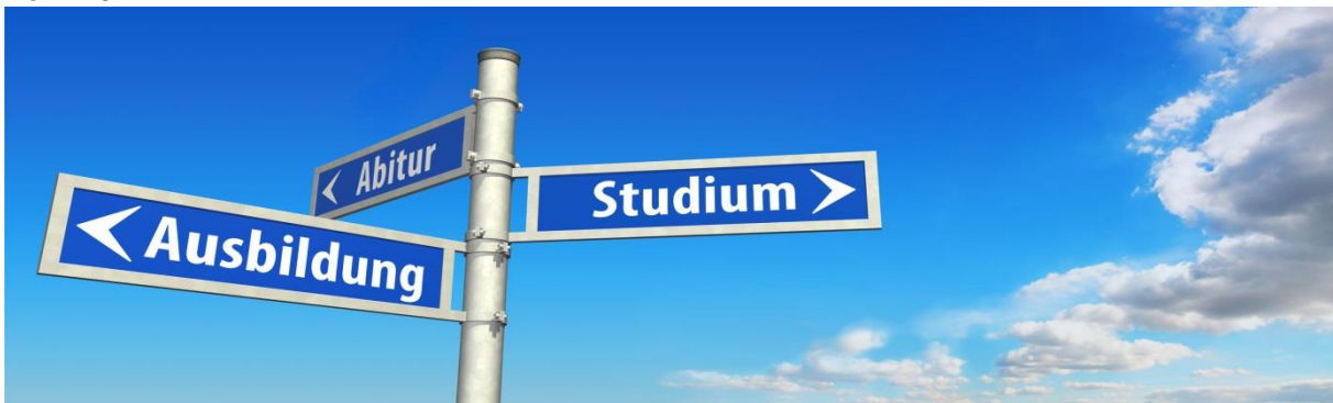
Schule und dann? Eine strukturierte Berufs- und Studienorientierung unterstützt die jungen Menschen bei Ihrer Entscheidung.

Durch die Umsetzung werden jedes Jahr knapp 3.500 Schülerinnen und Schüler der Jahrgangsstufe 8 im Kreis Soest beginnen, die verschiedenen Standardelemente der Berufs- und Studienorientierung zu durchlaufen. Diese Standardelemente sollen allen Schülerinnen und Schülern aus allen Schulformen als vorgeschriebener Mindeststandard zu Gute kommen.