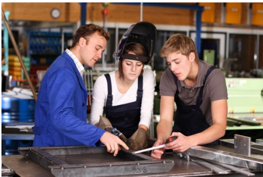
Praxisnahe Einblicke in Berufsfelder

Die Berufsfelderkundung wird im Unterricht vor- und nachbereitet und von Lehrkräften begleitet.