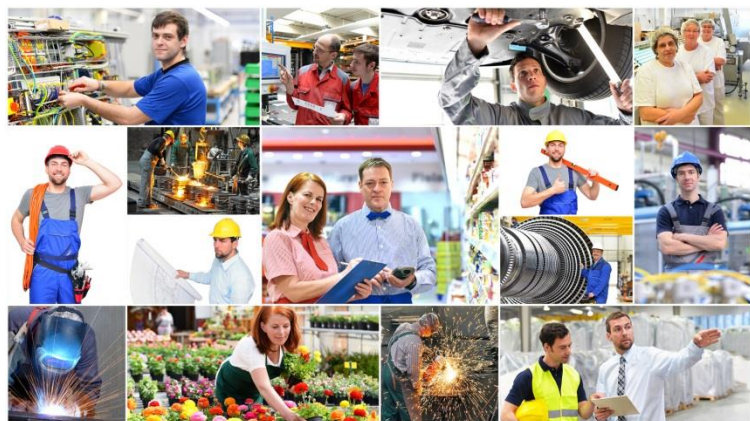
Bei der Vielzahl an Berufsbildern ist eine breite Beteiligung der Betriebe für die Perspektive der Jugendliche sehr wichtig.

Unter Einbeziehung der Ergebnisse der Potenzialanalyse reflektieren sie ausgewählte Fähigkeiten durch reale betriebliche Erfahrungen, auch als Gegenerfahrung zu traditionell als