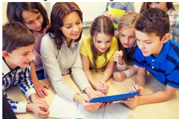
Eine gute schulische Vor- und Nachbereitung ist ein wesentlicher Teil der Berufsfelderkundung.

Unter Einbeziehung der Ergebnisse der Potenzialanalyse reflektieren sie ausgewählte Fähigkeiten durch reale betriebliche Erfahrungen, auch als Gegenerfahrung zu traditionell als geschlechertypisch angesehenen Berufsfeldern (Entscheidungs- und Handlungskompetenz).