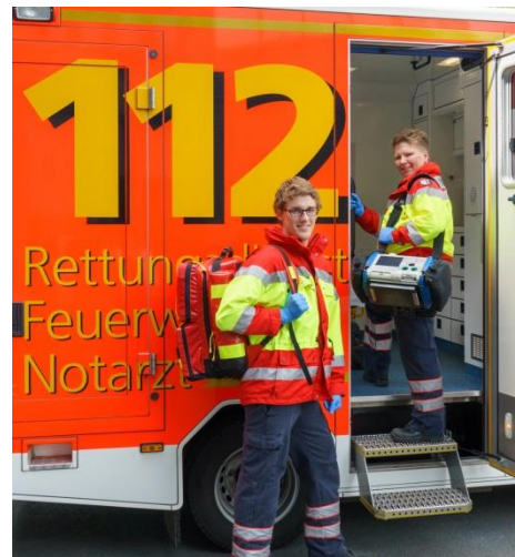
In speziellen Bereichen (hier Rettungsdienst), müssen die Berufsfelderkundungsangebote angepasst werden.

Berufsfelderkundungen können je nach Betrieb und Berufsfeld unterschiedlich ausgestaltet werden. Bei der Durchführung von Berufsfelderkundungstagen können grundsätzlich zwei verschiedene Herangehensweisen unterschieden werden. Neben Gruppenangeboten können auch für einzelne Interessierte Angebote zur Berufsfelderkundung bereitgestellt werden.